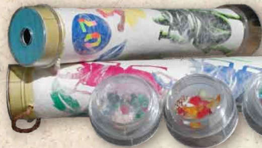
★手すき和紙万華鏡作り